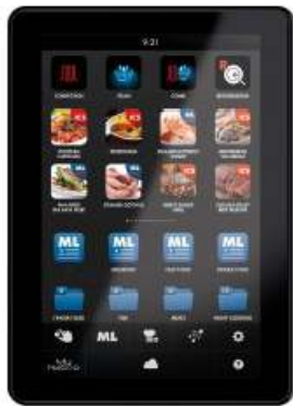
LCD 10" Touch Screen