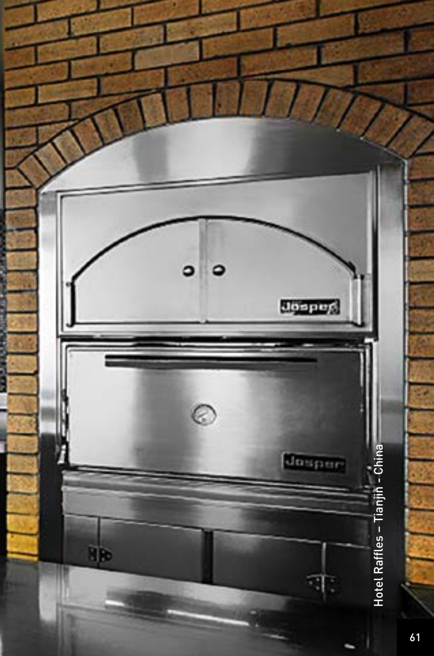
Hotel Raffles - Tianjin - China