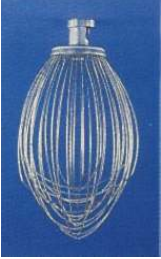
"D" 와이어 웹 (스테인레스)-1개 DWHIP-SST005