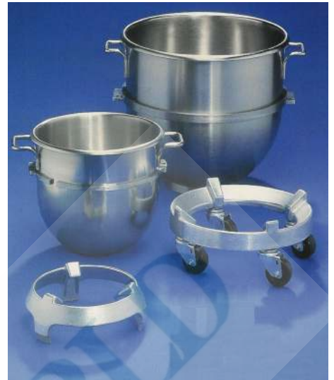
믹싱볼 5 리터-1개 BOWL-SST005