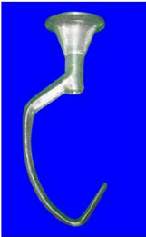
"E" 도우 훅 (알루미늄)-1개 EDOUGH-ALU005