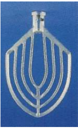
비터 (알루미늄)-1개 BBEATER-ALU005