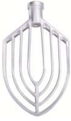
비터 (알루미늄)-1개 BBEATER-HL20