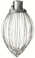
"D" 와이어 웹 (스테인레스)-1개 DWHIP-HL20