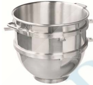
믹싱볼 20 리터-1개 BOWL-HL20