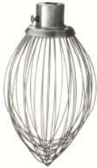
"D" 와이어 웹 (스테인레스)-1개 DWHIP-HL4030