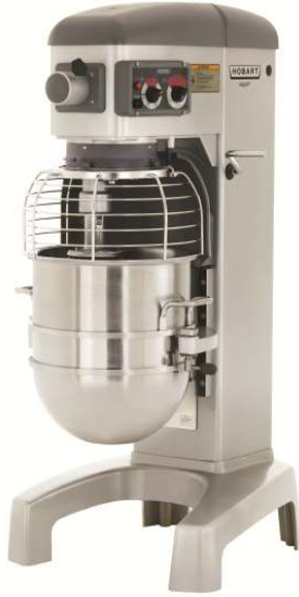
인체공학적인 회전식 볼