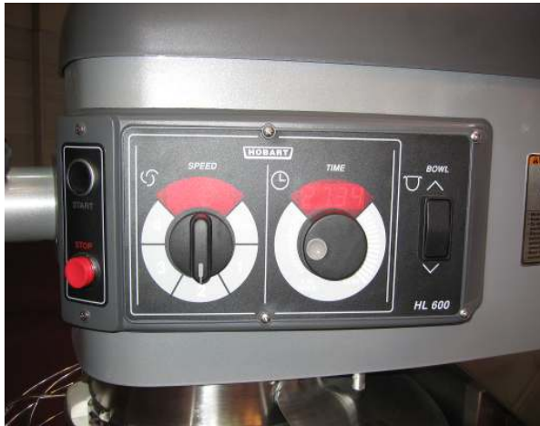
조작이 간편한 첨단 컨트롤 방식