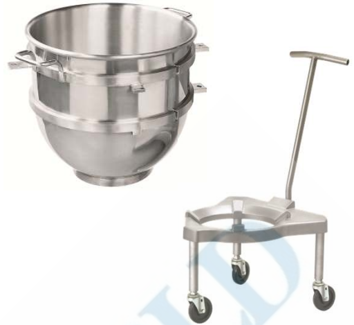
믹싱볼 60 리터-1개 : BOWL-HL60