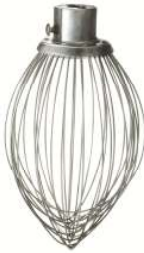
"D" 와이어 웹 (스텐레스)-1개 DWHIP-HL60