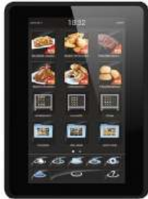
LCD 10인치 터치 스크린